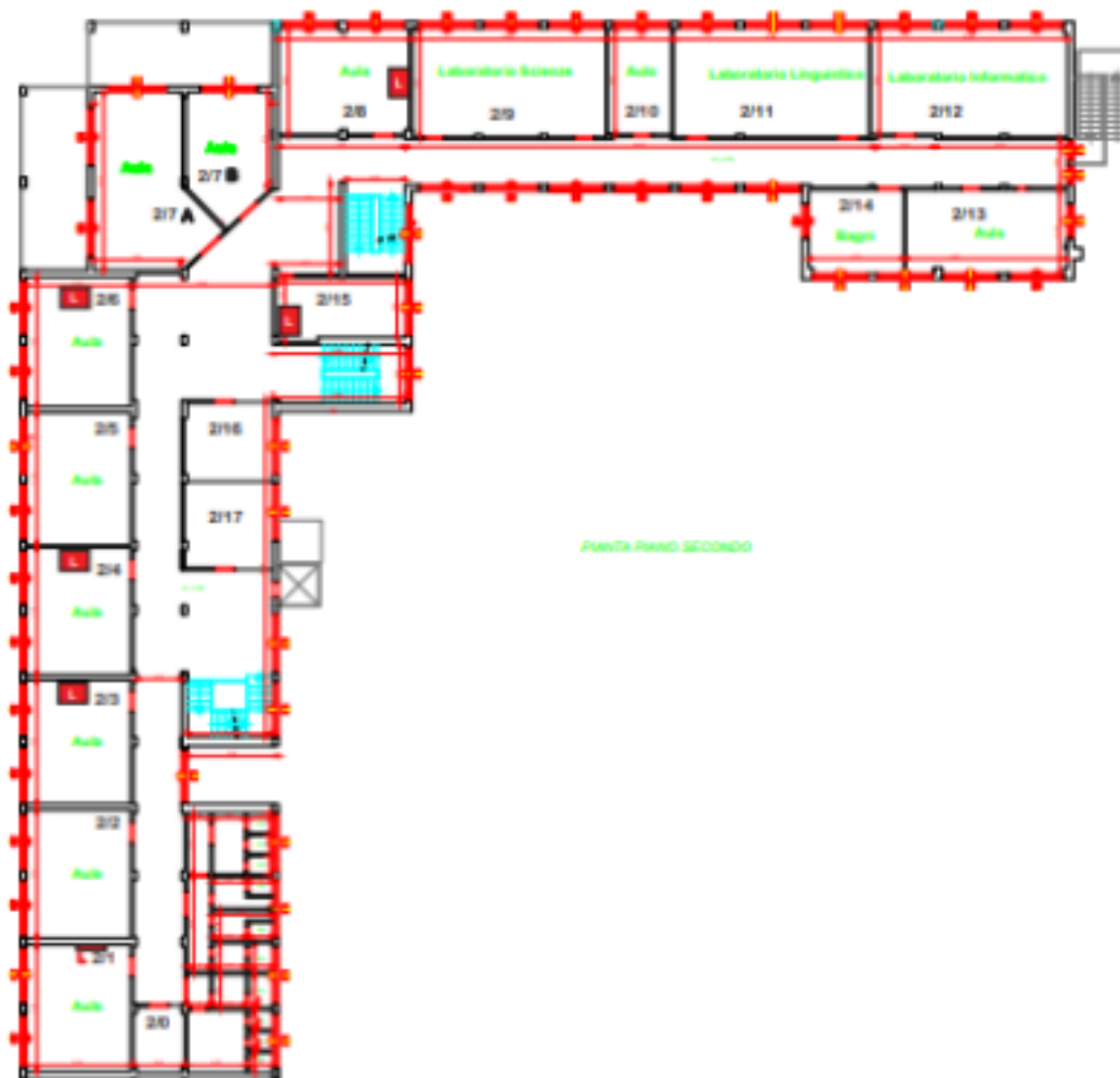
PLANIMETRIA SEDE LICEO CLASSICO E ARTISTICO VIA L.DAVINCI