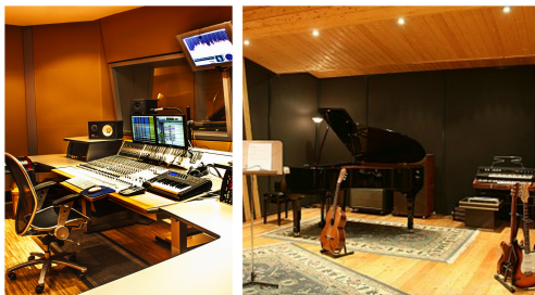
FIGURE PROFESSIONALI DI INDIRIZZO

Proseguimento degli studi presso qualsiasi Facoltà universitaria ed in particolare: corsi triennali e biennali di Alta Formazione Musicale, DAMS, Concorsi selettivi per le orchestre presso enti teatrali e nazionali, attività concertistica in formazione o solista, corsi IFTS.